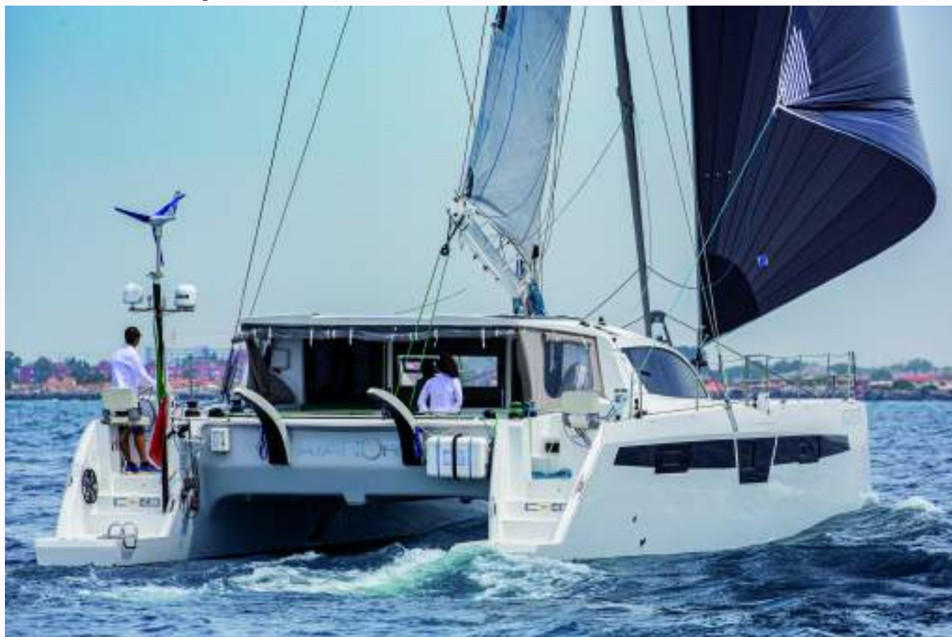
Il C-Cat 48 in navigazione al lasco con Code Zero

Le condizioni del test erano di onda che iniziava a formarsi, 1 metro abbondante, e vento dai 10 ai 13-14 nodi , nelle quali abbiamo navigato prima con randa e fiocco, poi con Code zero. Ci aspettavamo che di bolina l'onda già abbastanza formata potesse infastidire un po' la navigazione, la risposta invece è