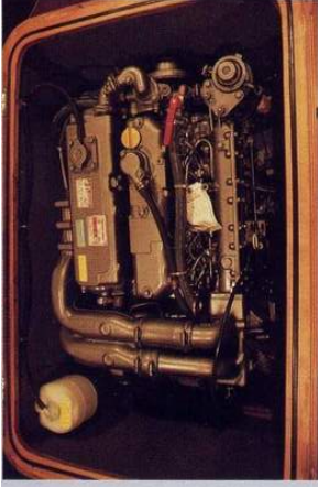
Motore centrale - Central mounted engine

Certamente la struttura costruttiva dello scafo costituisce il miglior biglietto da visita del comet 50 cl. Per farlo, in Comar abbiamo utilizzato la tecnica del "sandwich diversificato", incollato sotto vuoto. La laminazione viene effettuata esclusivamente con tessuti biassiali e unidirezionali orientati secondo una mappa degli sforzi. Nell'opera viva, il core è costituito da balsa, mentre nelle murate in coperta abbiamo utilizzato il più leggero termanto. Un reticolo di serrette e madieri, laminato in opera contribuisce a irrobustire ulteriormente lo scafo, mentre una poderosa ordinata laminata in opera scarica lo sforzo, con rinforzi locali in kevlar nelle zone di maggiore stress (bulbo, lande, ecc). In coperta il comet 50 cl offre due pozzetti separati e ampi spazi prendisole per l'utilizzo in crociera. Il motore, potentissimo e montato in posizione centrale, contribuisce all'ottimale disposizione dei pesi. L'eccellente rapporto tra il piano velico e il dislocamento garantisce ottime prestazioni alla vela, coadiuvato in più dall'attrezzatura Harken (di serie il comet 50 cl monta, ad esempio, otto pozzetti serie "black magic" caricati carbonio, un albero passante a tre ordini di crocette e il bulbo in piombo). Il disegno della carena è alla base della proverbiale stabilità di rotta di questo modello.