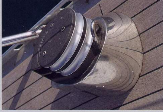
Ferramenta inox 316 - s.s. 316 fittings