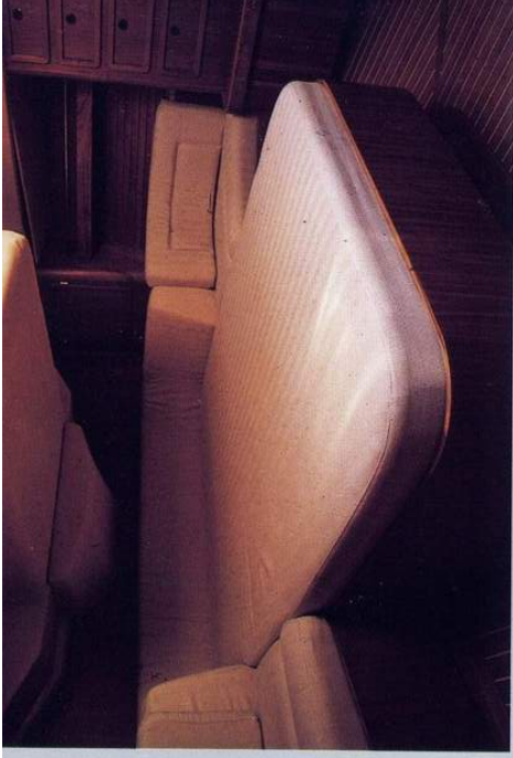
Cabina Armatoriale - Armatoriale aft cabin

W ithout doubt the new comet 50 cl structure is her best presentation card. To build her at Comar we use the "diversified sandwich" vacuum bagged technique, using vinylester resin on the first coat, against osmosis. The hull is balsa cored while for the topsides and the deck we use the lighter termanto. A combination of floors and stringers, directly moulded to the hull and the use of kevlar reinforcements gives ulterior strength to the hull around the keel and the chainplates. On deck, our comet 50 cl offers two separate cockpits and plenty of sunbathing space. Her powerful central mounted engine gives her a perfect weight balance. An excellent sail area/displacement ratio guarantees good sailing performance, with the aid of impressive Harken deck gear: the comet 50, for example, offers as standard a battery of eight "black magic" blocks, with carbon charged bearings, which lead back the lines from the mast. The comet 50 cl's hull design and route stability are the strengths of this model.