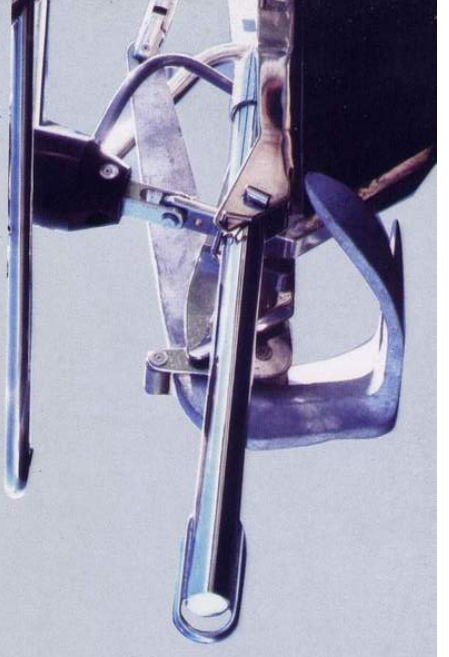
Bompreso opzionale - Optional Bowsprit

W ithout doubt the new comet 50 cl structure is her best presentation card. To build her at Comar we use the "diversified sandwich" vacuum bagged technique, using vinylester resin on the first coat, against osmosis. The hull is balsa cored while for the topsides and the deck we use the lighter termanto. A combination of floors and stringers, directly moulded to the hull and the use of kevlar reinforcements gives ulterior strength to the hull around the keel and the chainplates. On deck, our comet 50 cl offers two separate cockpits and plenty of sunbathing space. Her powerful central mounted engine gives her a perfect weight balance. An excellent sail area/displacement ratio guarantees good sailing performance, with the aid of impressive Harken deck gear: the comet 50, for example, offers as standard a battery of eight "black magic" blocks, with carbon charged bearings, which lead back the lines from the mast. The comet 50 cl's hull design and route stability are the strengths of this model.