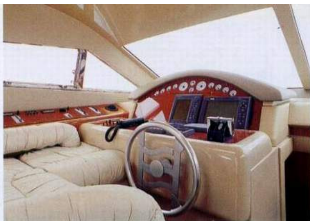
Sopra, la postazione di guida ben rifinita e con una ricca dotazione di strumenti. Sotto, lo spazioso quadrato con la funzionale suddivisione delle zone: living, guida e cucina.