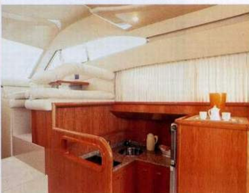
Sopra, la zona della cucina posizionata nel salone centrale ma a un livello del ponte leggermente inferiore. Funzionalità e privacy.

trale che funge anche da gruetta per il tender. La prua è dotata di un grande materasso prendisole.