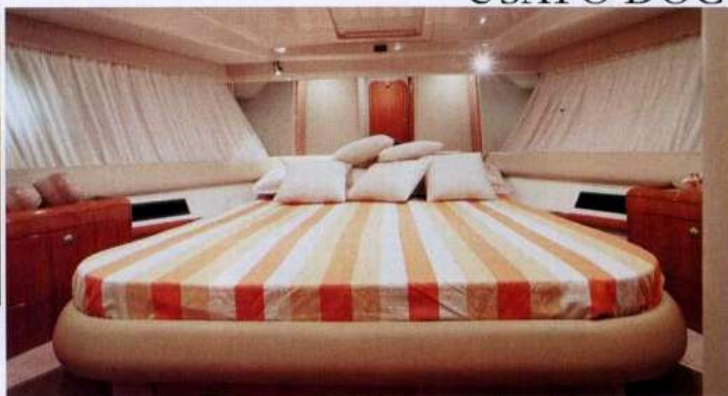
Sopra, la cabina armatoriale di prua con il grande letto centrale. Le altre due cabine sono con letti singoli. Due i bagni a bordo.