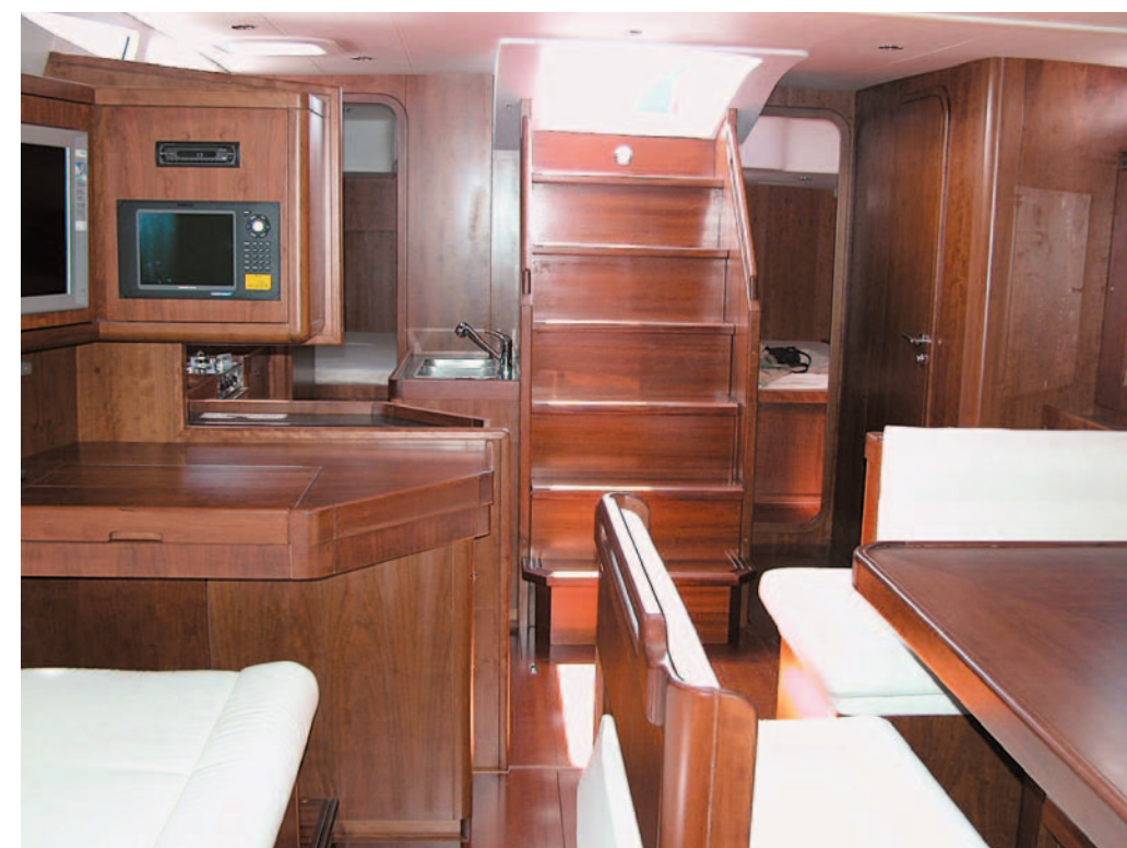
Sopra, una visuale della dinette con in primo piano la scala d'ingresso agli ambienti interni. Si nota la giusta inclinazione dei gradini e la presenza di tientibene utili in caso di passaggio con mare formato. L'assenza di spigoli vivi denota la cura che si è posta nell'ergonomia generale.