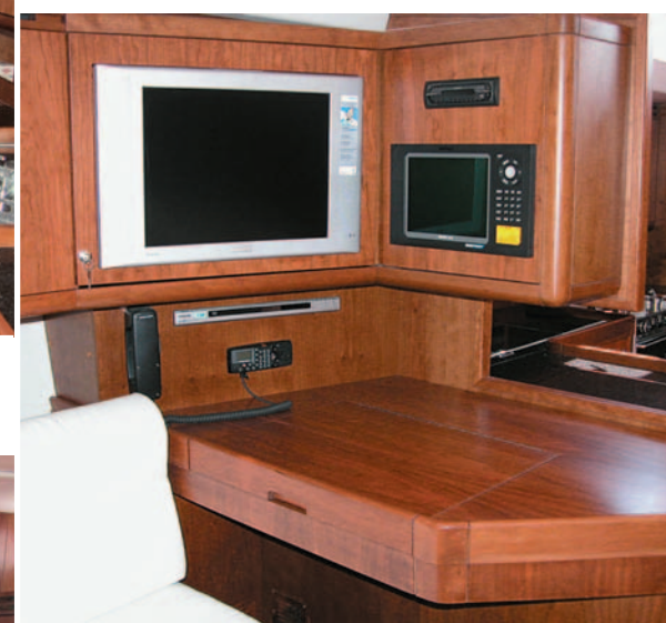
Al centro, in alto, una delle cabine presenti nel primo esemplare dell'Hidra 54 fornita di letto matrimoniale dalle misure generose. Sopra, la cucina con pianta a U dotata di tutti i generi di comfort. A destra, la zona carteggio con la strumentazione necessaria alla navigazione.