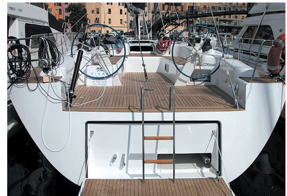
A lato, lo specchio di poppa ha al suo interno un piano che aperto consente di ottenere una spiaggetta comoda nelle soste in rada.

su stampo femmina con l'utilizzo di tessuti di vetro preimpregnati con resina epossidica, trattamento sottovuoto e postcura in forno. Elegante e dotato di una forte personalità, il layout di coperta è caratterizzato da una tuga bassa e corta e da un pozzetto dalle notevoli dimensioni. In quest'ultimo, fornito di doppia timoneria che agevola il passaggio verso poppa, arrivano tutte le manovre correnti, che scorrendo a scomparsa permettono di ottenere ampi spazi da poter dedicare a prendisole. L'al-