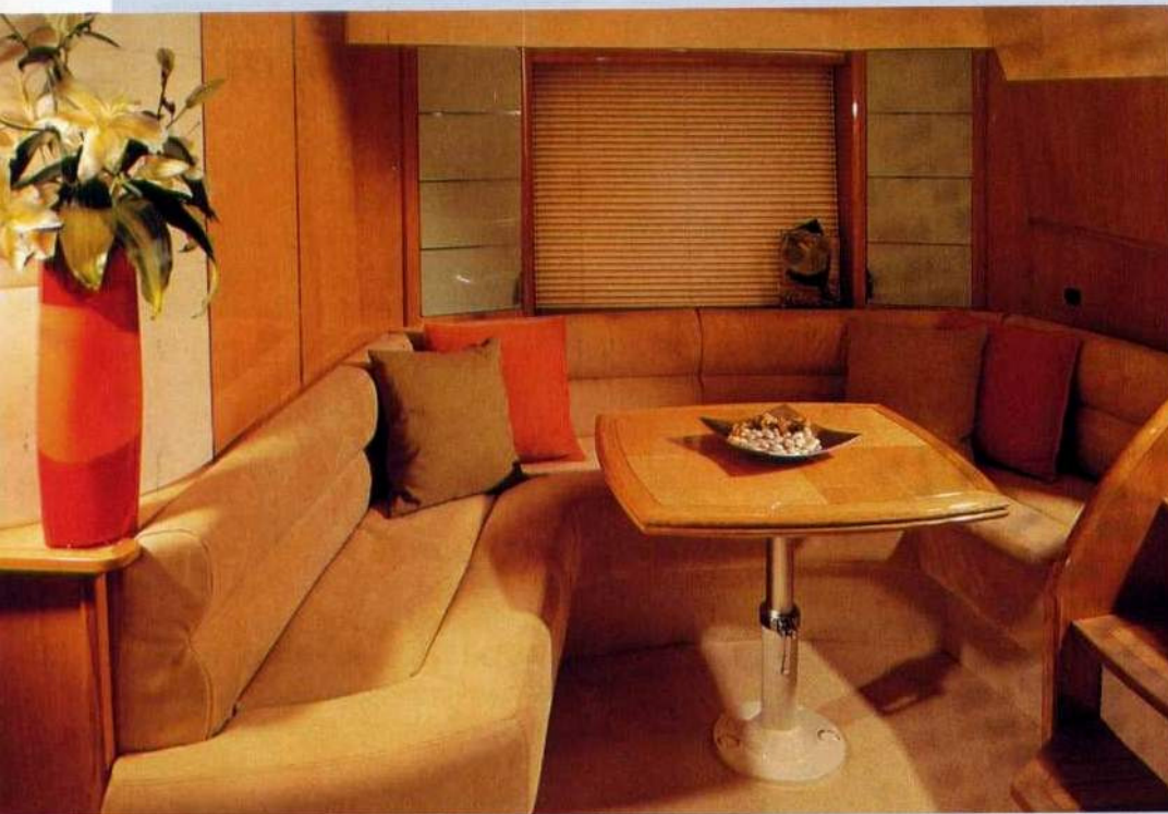
A sinistra, la dinette dispone di un grande e confortevole divano a U in grado di ospitare fino a 10 persone. Sotto, la cucina offre generosi volumi di stivaggio.