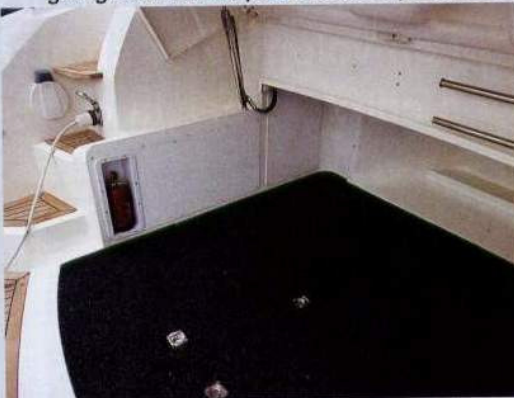
A fianco, una vista dell'intero pozzetto. Sotto, il garage del tender, posto sotto al prendisole

★ SCARSO ★★ SUFFICIENTE ★★★ DISCRETO ★★★★★ BUONO ★★★★★ OTTIMO