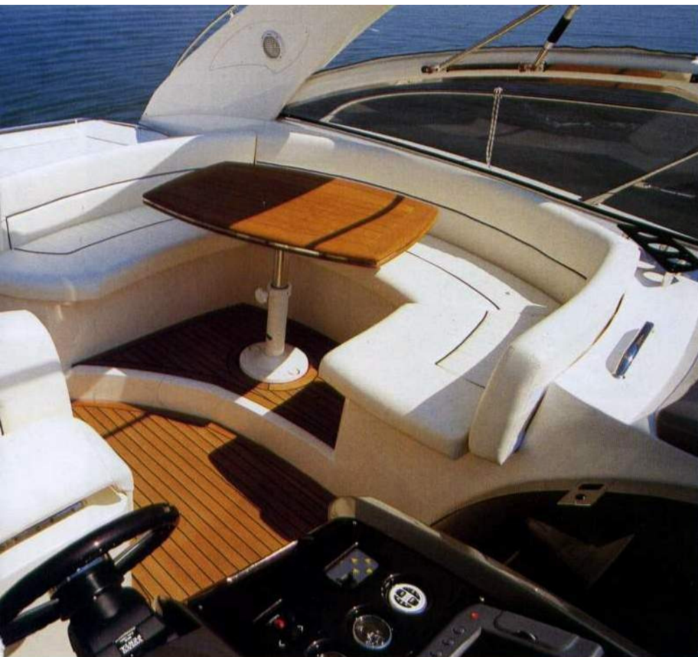
Sotto, la passerella scompare all'interno di un gradino. A destra, design moderno per il cruscotto.

Sul lato opposto è stato ricavato un funzionale angolo bar-cucina dotato di lavello controstampato e di un piano di lavoro che può essere attrezzato, a discrezione dell'armatore, sia con un barbecue sia con piastre di cottura, il tutto ovviamente a scomparsa. La base del mobile ospita un frigorifero e uno stipetto, all'interno del quale si trova lo staccabatterie elettronico. La postazione di guida con un piccolo divanetto a due posti per pilota e copilota, con seduta abbattibile per la guida in piedi, sfoggia un cruscotto dal design particolarmente ricercato, di ispirazione automobilistica, in vernice lucida metallizzata antigraffio con un elegante contrasto di colori: grigio chiaro e antracite. Gli strumenti di controllo motori sono sistemati in modo da consentire una immediata lettura in ogni situazione. Generosi spazi sono inoltre stati riservati alla strumentazione elettronica, al Vhf e all'ecoscandaglio forniti di serie, e ai vari comandi. Bello anche il volante antracite metallizzato a tre razze in acciaio. Da apprezzare la spiaggia poppiera, i gradini di accesso ai passavanti e l'intero pozzetto rivestiti in teak. Una seconda superficie prendisole è posta sulla tuga prodiera.