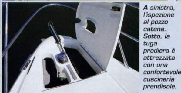
A sinistra, l'ispezione al pozzo catena. Sotto, la tuga prodiera è attrezzata con una confortevole cuscineria prendisole.