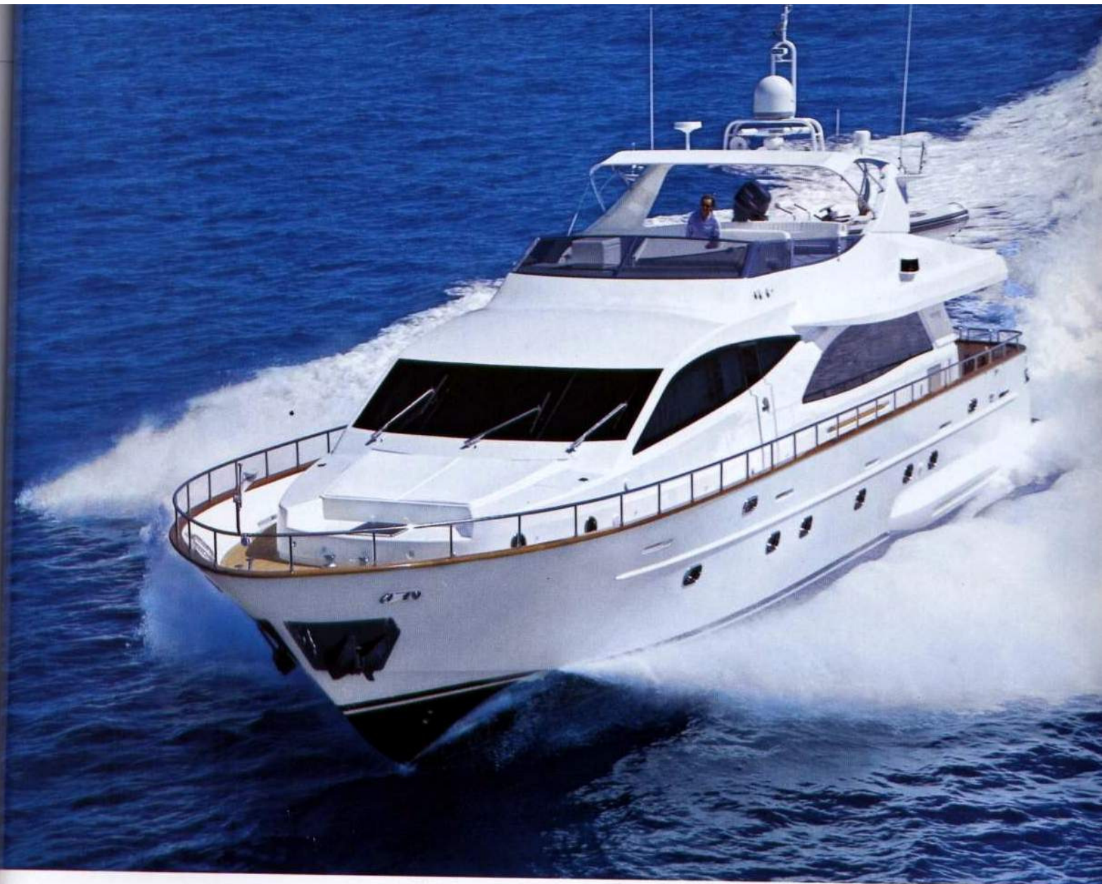
Qui sopra, l'immagine del Falcon 90 in navigazione mostra le sue linee pulite e ben avviate e un assetto ottimale. Sotto, il tavolo da pranzo, allungabile fino a 10 posti. Nell'altra pagina, una vista da poppa del salone open space, con la zona conversazione in primo piano. Above: a photo of the Falcon 90 under way which shows off her clean and impressive lines and an excellent trim. Below: the dining table, which can be extended to 10 seats. Opposite page: an aft view of the open space saloon with a close-up of the conversation area.