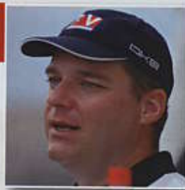
di VANNI GALGANI

A meno di un anno dalla nascita del primo esemplare Raised Saloon, il 52, l'attivissima Comar propone la secondogenita di questa linea dedicata alla crociera, che costituisce anche la nuova ammiraglia del cantiere. Progettato dalle stesse mani e secondo gli stessi principi della sorella minore, il neonato Comet 62 trova le necessarie dimensioni per sviluppare ulteriormente, e in modo più radicale, il tema conduttore della gamma RS: la vivibilità. Questo concetto, che non va confuso con la capienza, comprende tutti quegli aspetti, dalla distribuzione degli spazi alla conformazione degli ambienti all'ergonomia, fino ai piccoli dettagli, che rendono la vita a bordo un vero piacere. Possono sembrare